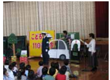
「自分の命を守る学習会」

5月21日、「自分の命を守る学習会」を行いました。広島西警察署少年育成官の方から講話をいただくとともに、地域の方々に劇をやっていただきました。とてもわかりやすく、子どもたちにとっては心に残るものとなりました。また、5月23日には3年生が外部の方に講師をお願いして鈴が峰山登山を行いました。その際、保護者の方が引率のお手伝いをしてくださいました。おかげさまで安心して活動を行うことができました。その他、クラブ活動にご協力いただくなど、いろいろな教育活動の場面で地域の方や保護者の方にご協力をいただいております。心からお礼申し上げます。